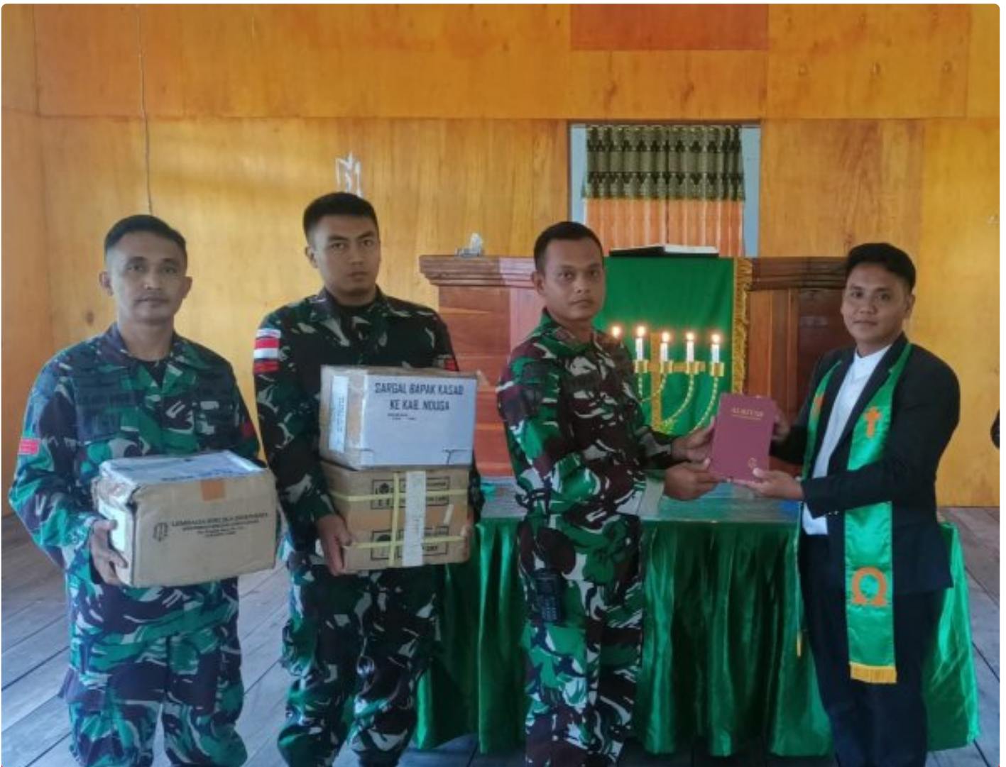
Foto: Satgas Yonif 503/Mayangkara kembali menunjukkan dedikasinya kepada masyarakat di Papua dengan memberikan dukungan alat musik untuk kegiatan ibadah di Gereja GKI Bethesda Batas Batu, Distrik Krepkuri,